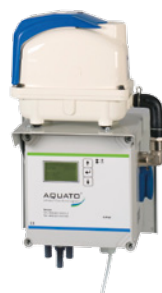
Steuerung K-Pilot 18.1