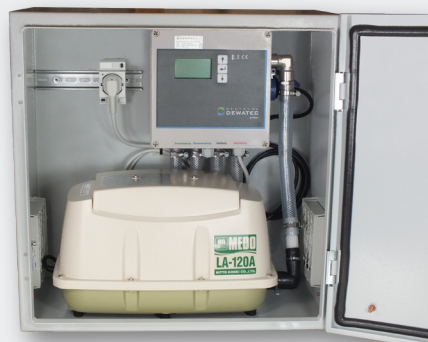
Stahlschrank für den Innen- und Außenbereich