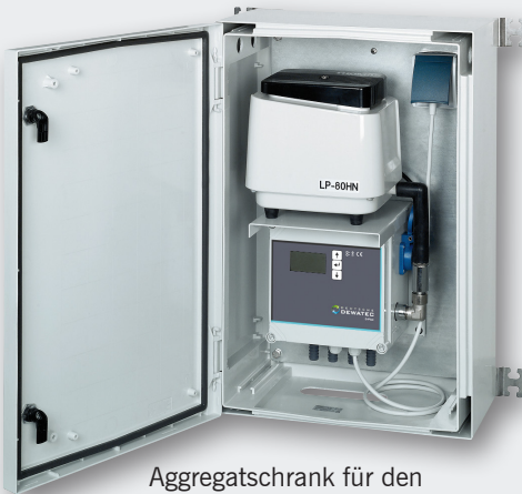
Aggregatschrank für den Innen- und Außenbereich