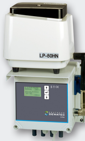
Aggregatkonsole für den wettergeschützten Innenbereich

Wetterfester Schaltschrank für den Einsatz im Außenbereich